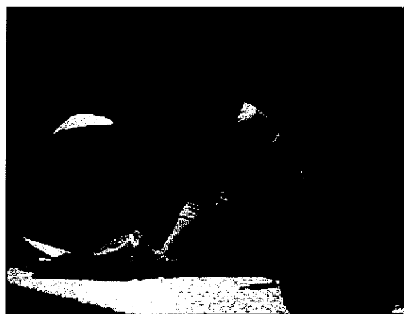
Plutôt qu'un discours, la médiation familiale était mise en scène par des comédiens du Théâtre D'y Voir.

Moselle ont contribué à faire passer une information dont le sujet souvent pénible était traité sous la forme plus légère de deux couples mis en scène, proches de la rupture, l'un dans un milieu urbain l'autre, dans le contexte d'une exploitation agricole. Dans les deux cas, les conjoints se sentent de plus en plus éloignés l'un de l'autre et envisagent la rupture. Si elle est inévitable, comment s'y prendre pour la rendre la moins pénible, peut-être, la plus équitable et pourquoi pas, finalement l'éviter. Après les scènes de ménages de deux couples servis par des acteurs amateurs remarquables, les comédiens se retrouvent entre une authentique médiatrice familiale qui va jouer le jeu. Entre chaque scène, une voix off commentera, analysera, décryptera l'état des relations entre les couples et le rôle de la médiatrice. Ainsi que