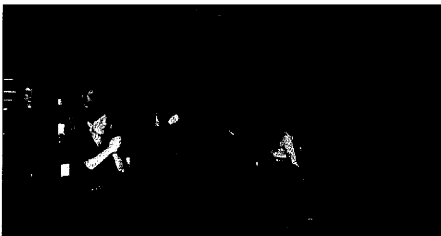
Près de 150 personnes ont assisté à la "conférence théâtrale" de l'École des parents de Moselle sur la scène de Créanto.

Renseignements : EPES7 au 03 87 69 04 87 et MJD de Faulquemont, l'allée René Cassin ou 03 87 90 00 22