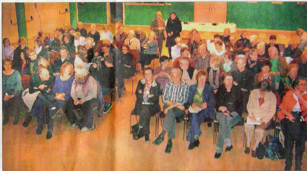
La « médiation familiale » concerne toutes les tranches d'âge, toutes les situations entre adultes au sein des familles.

En effet la médiation familiale est importante « pour essayer de régler à l'amiable les problèmes rencontrés lors d'une séparation ou d'un divorce, d'une rupture de lien familial, de problèmes dans les fratries dus au vieillissement des parents, d'un règlement d'une succession conflictuelle et autres, particulièrement dans le milieu agricole ». Le public a pu se rendre compte de l'importance